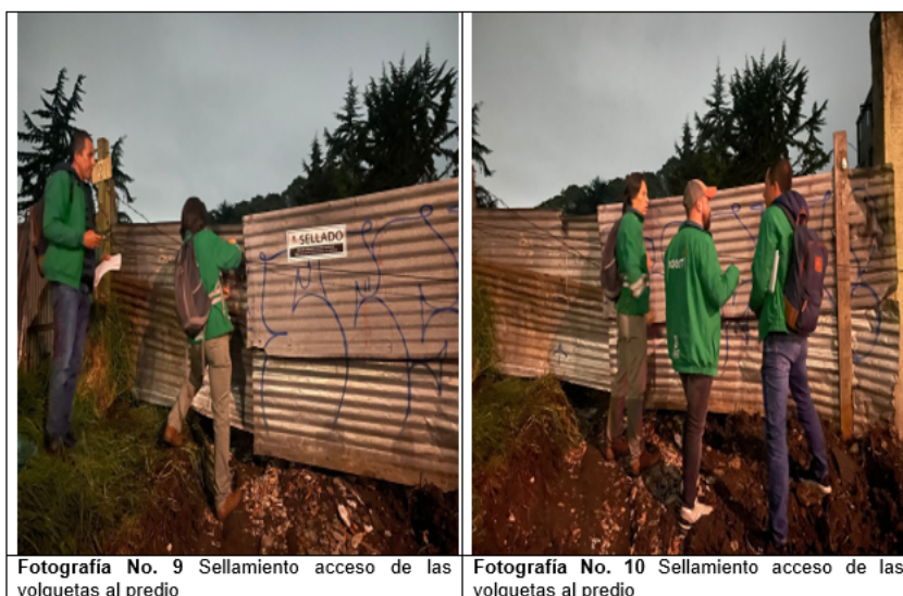
Fotografía No. 9 Sellamiento acceso de las volquetas al predio