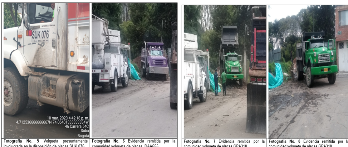
Fotografía No. 5 Volqueta presuntamente involucrada en la disposición de placas SUK 076